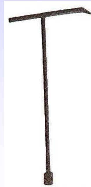
Klucz do stojaka hydrantowego